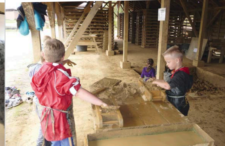
Praktisches Lernen – Exkursion zur Ziegelei in Lage

Unser pädagogisches Team verfügt über Zusatzqualifikationen in den Bereichen Dyskalkulie, Legasthenie, Hochbegabung und Psychomotorik.