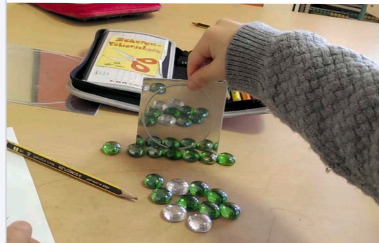
Ausprobieren und Entdecken – wir lernen verdoppeln

Mit einer zusätzlichen, pädagogischen Fachkraft in jeder Klasse hat unsere Schule mit ca. 10:1 einen besseren Betreuungsschlüssel als viele andere Schulen. Dies ermöglicht eine bessere Förderung und Forderung individueller Begabungen und Fähigkeiten der Schülerinnen und Schüler.