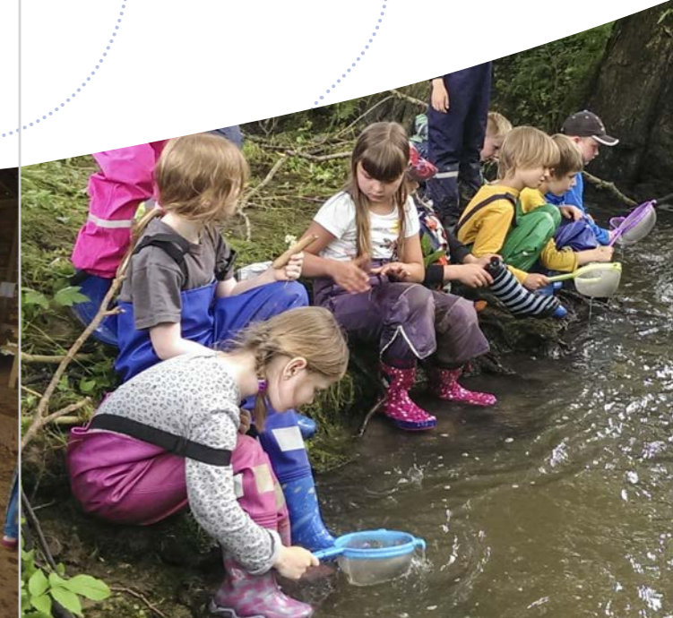
Nachmittags-Angebot – Expedition in den Forscherwald

Die Nachmittagsangebote und auch die Ferienspiele werden von unseren pädagogischen Fachkräften aus dem Vormittag durchgeführt.